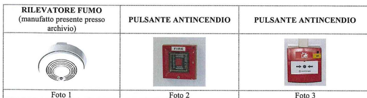
Foto 3: premendo con una semplice pressione del dito sul tondo nero indicato dalle due frecce vengono attivate le sirene di allarme antincendio e le misure di sfollamento dell'edificio.

Foto 2: rompendo il vetrino vengono attivate le sirene di allarme antincendio e le misure di sfollamento dell'edificio.