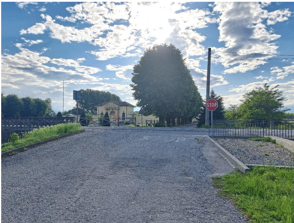
Fotografia n. 8