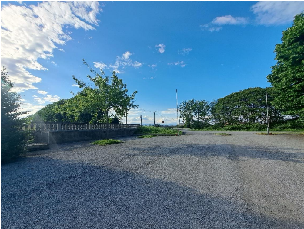
Fotografia n. 4