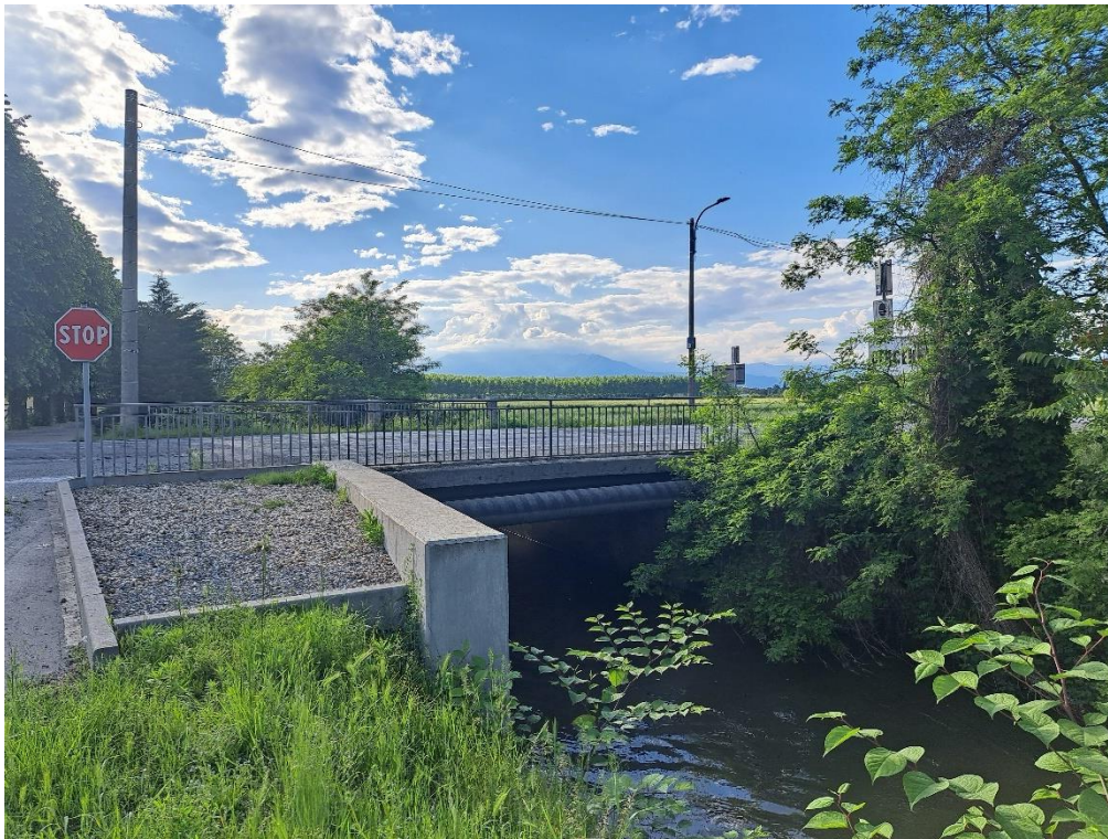
Fotografia n. 7