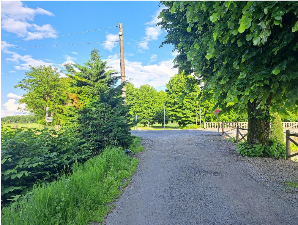
Fotografia n. 13