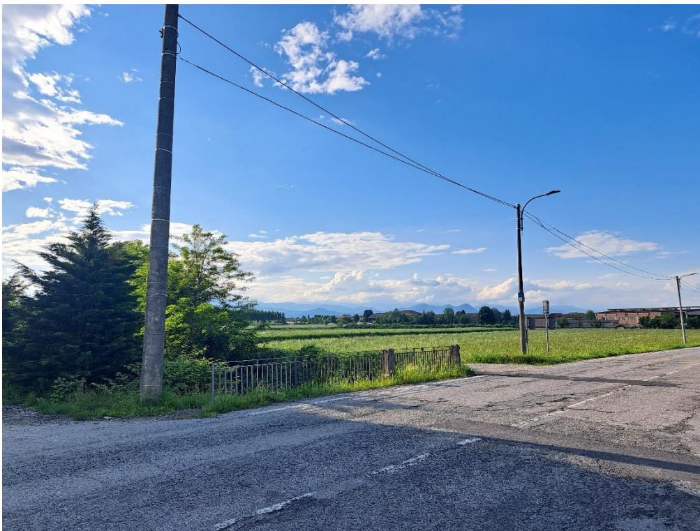
Fotografia n. 14