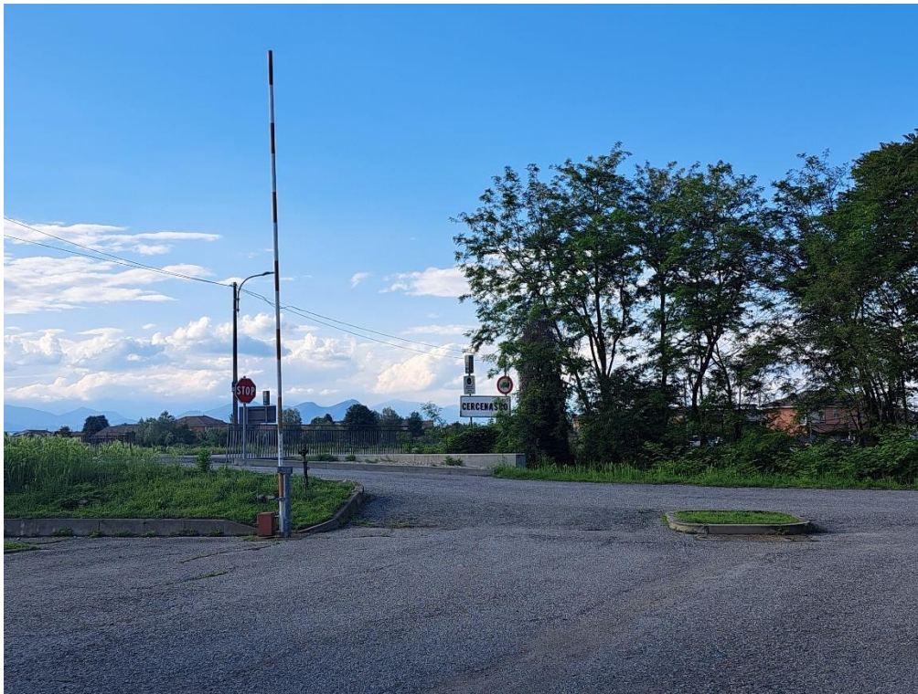
Fotografia n. 5