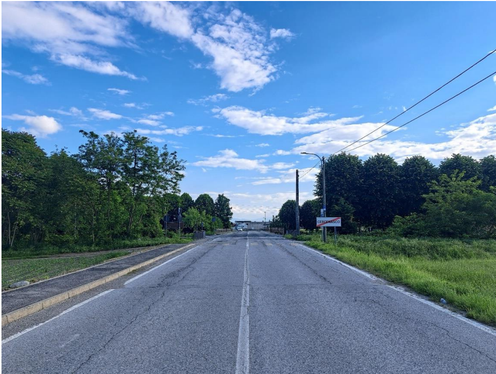
Fotografia n. 21