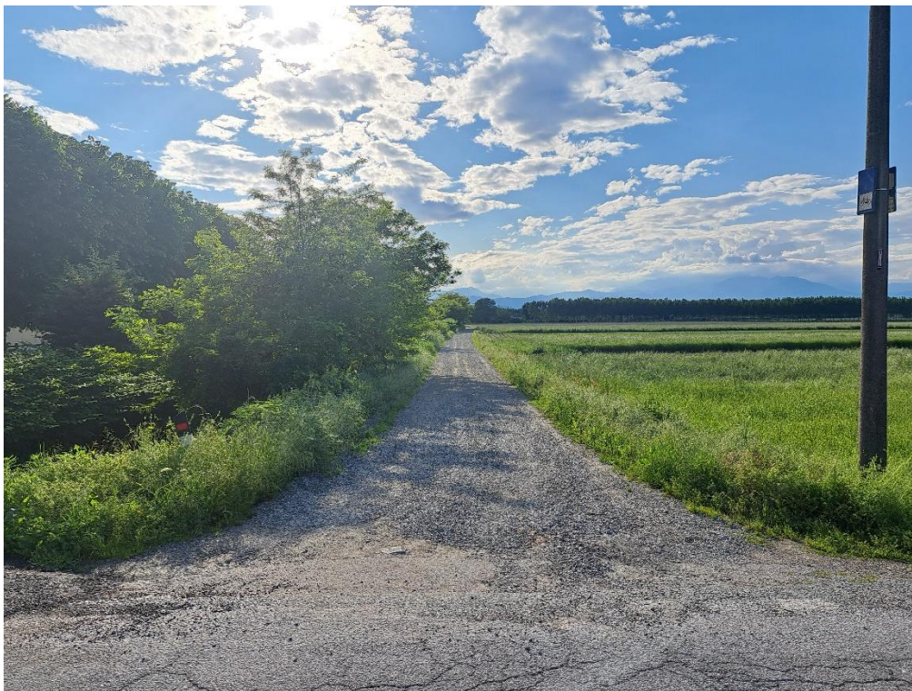
Fotografia n. 18