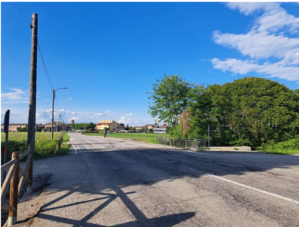
Fotografia n. 2