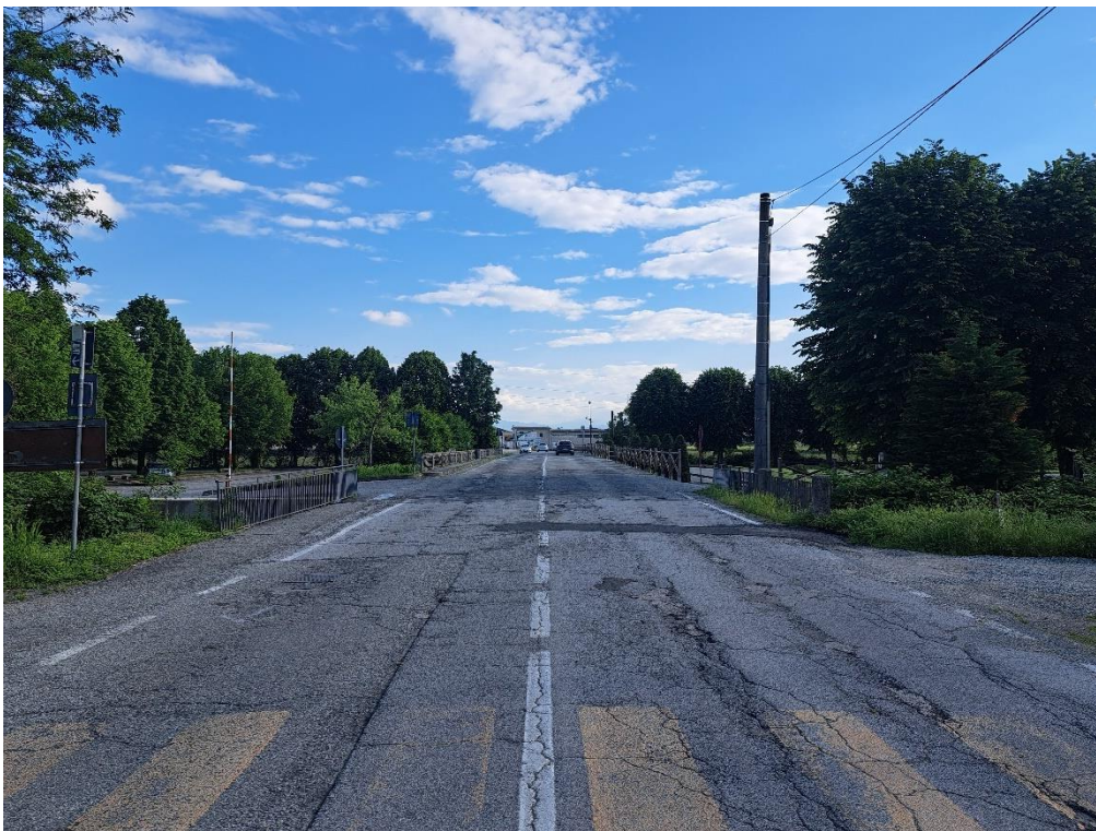
Fotografia n. 22