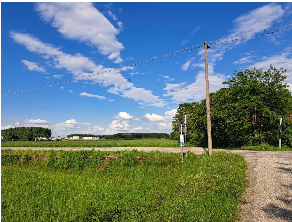
Fotografia n. 20