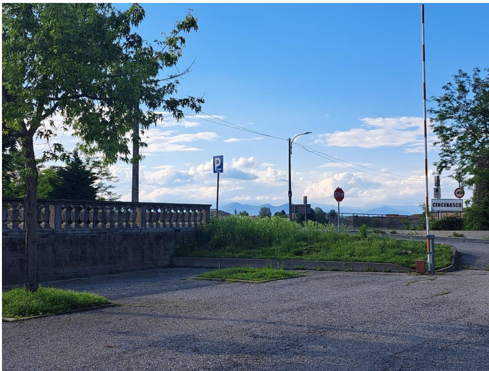
Fotografia n. 6