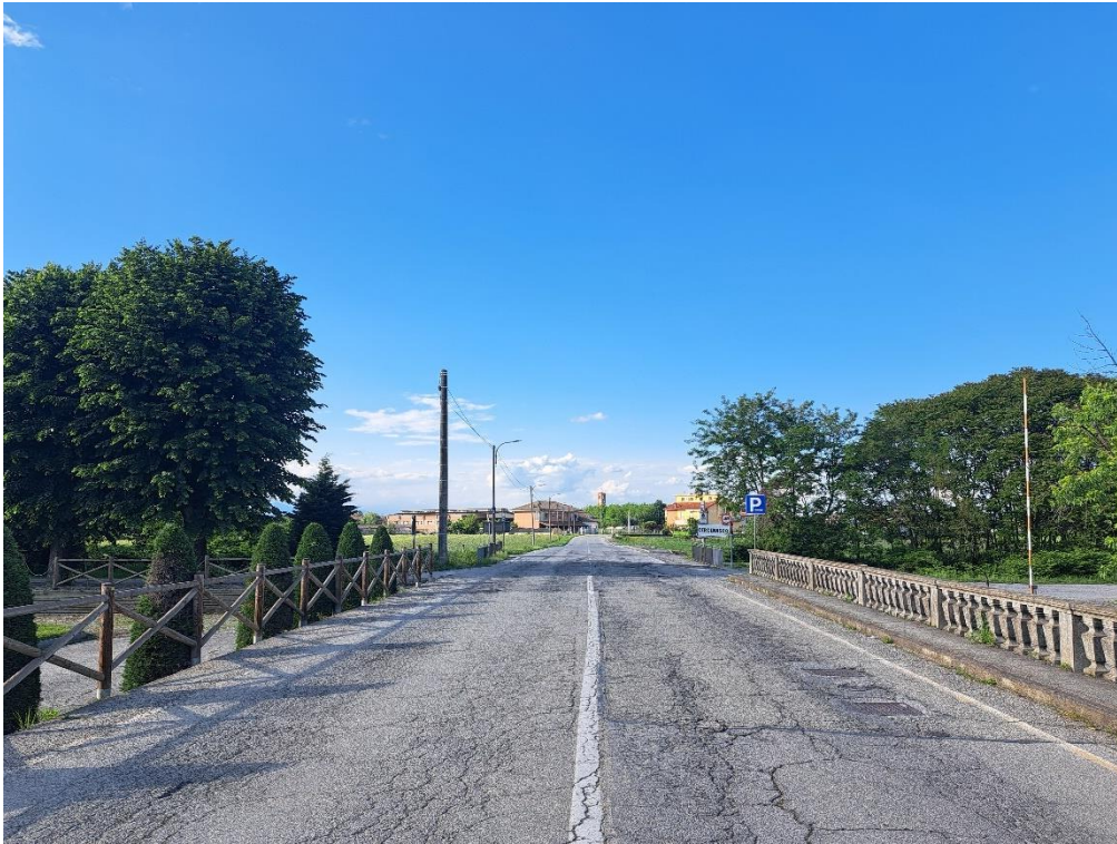
Fotografia n. 1