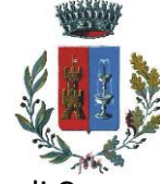
Comune di Cercenasco (To)