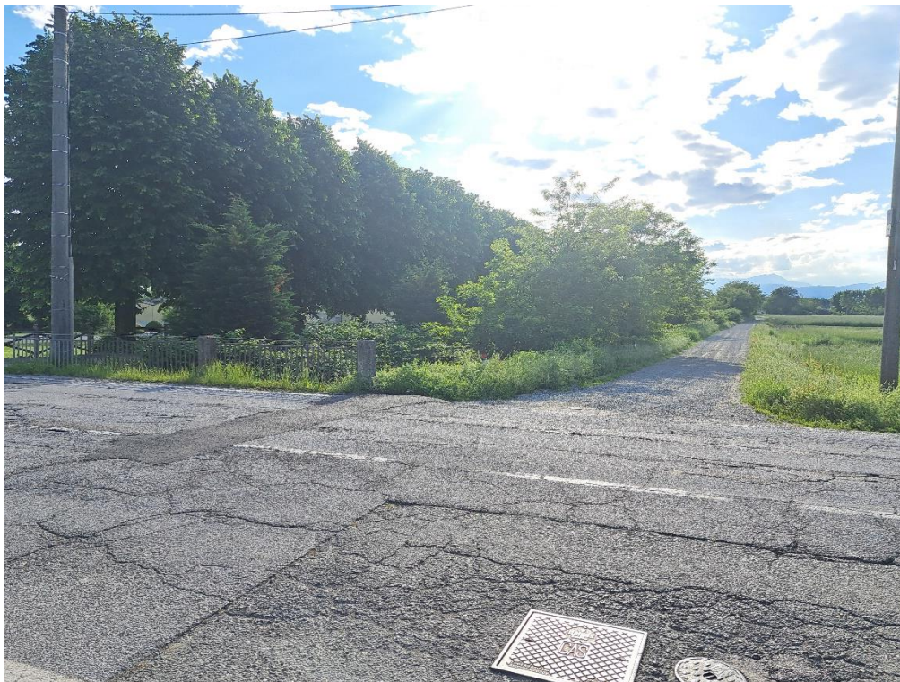
Fotografia n. 16