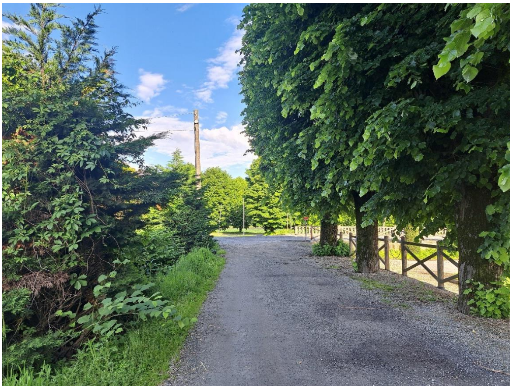
Fotografia n. 12