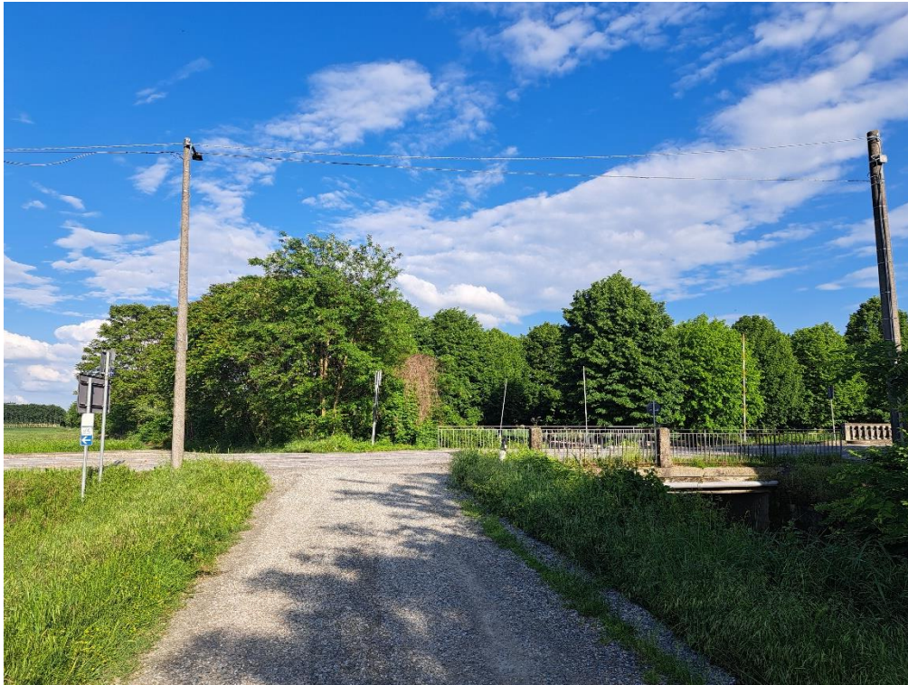
Fotografia n. 19