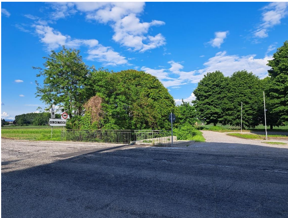
Fotografia n. 10