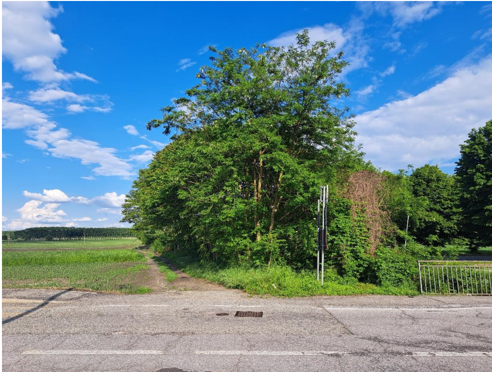
Fotografia n. 15