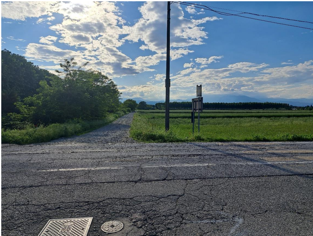
Fotografia n. 17