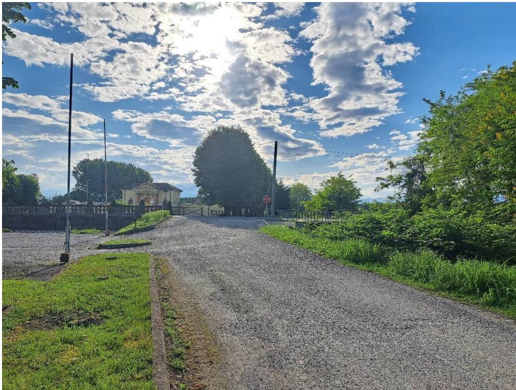
Fotografia n. 9