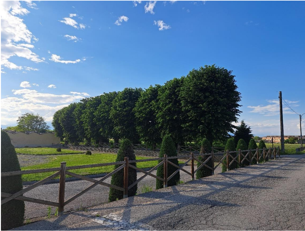
Fotografia n. 3