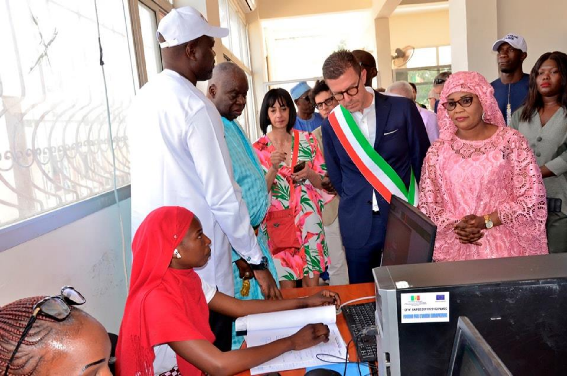
La visita all'Anagrafe di Tivaouane