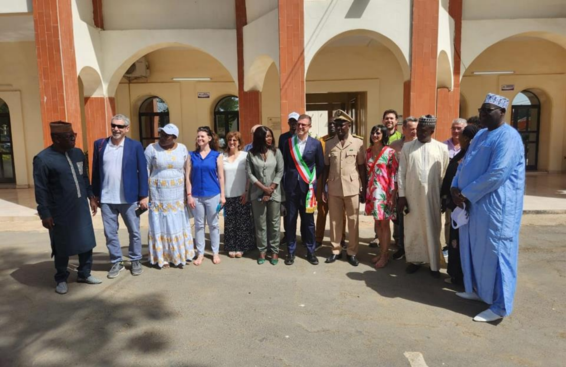
La visita al Prefetto di Tivaouane