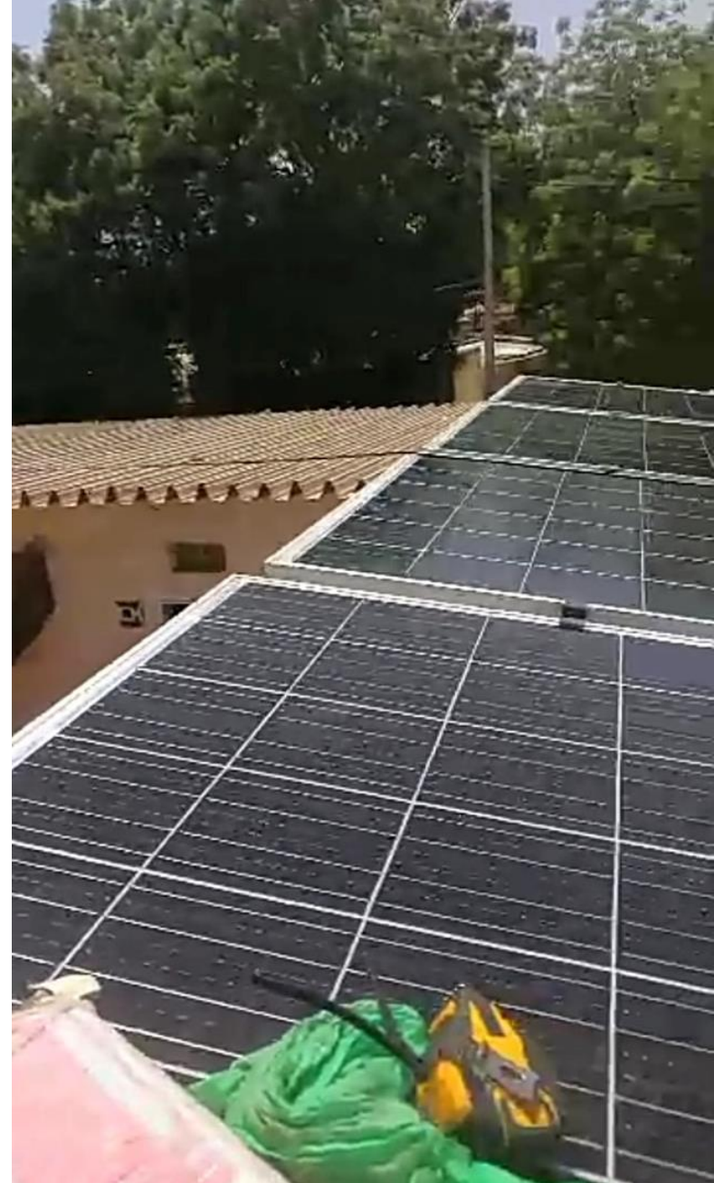
Il fotovoltaico alla Scuola 7