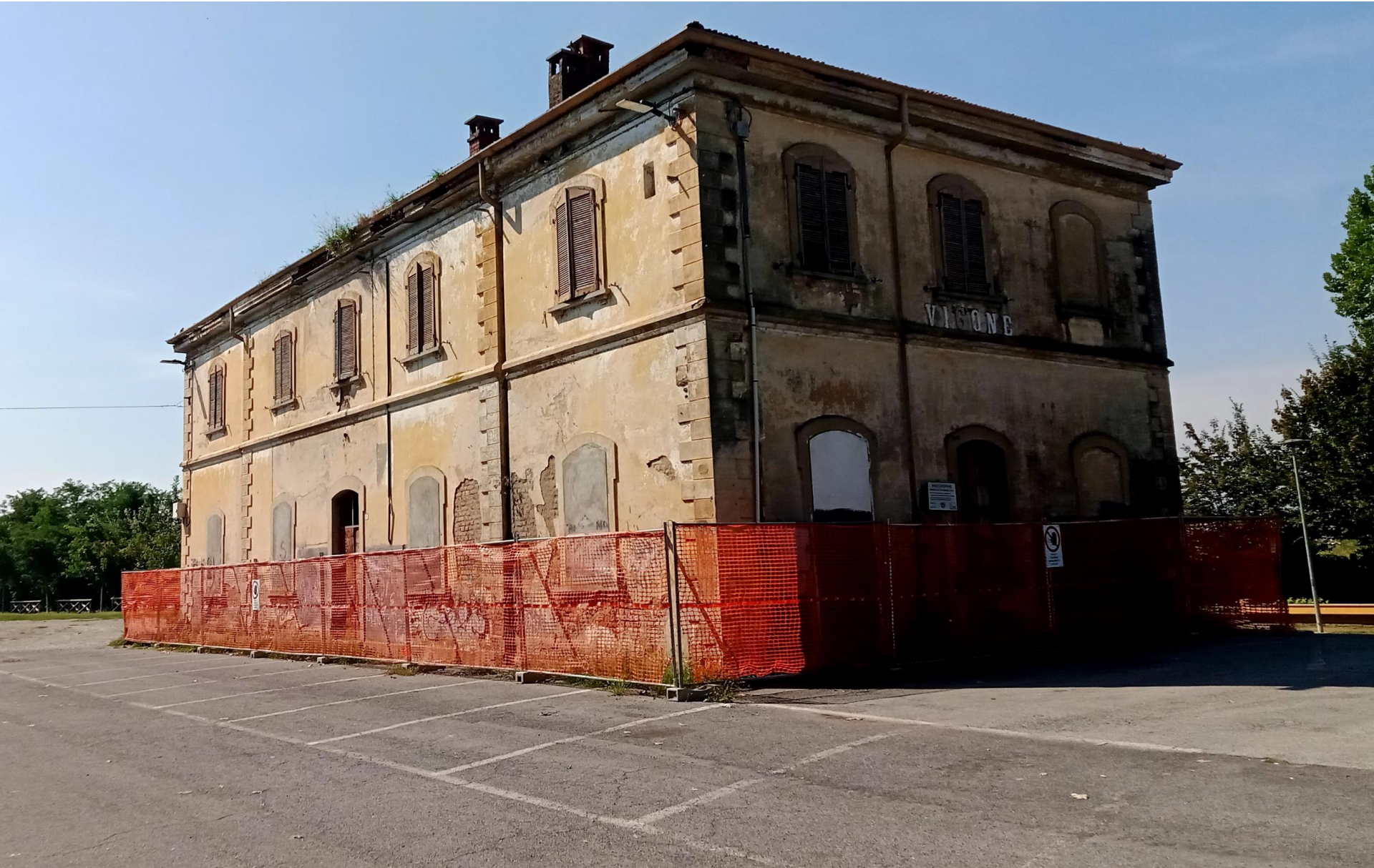
L'ex stazione ferroviaria