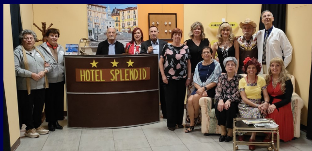
Commedia Brillante in due atti in lingua Piemontese (tratto da "Le Pillole d'Ercole" di Maurice Hennequin e Paul Bilhaud)