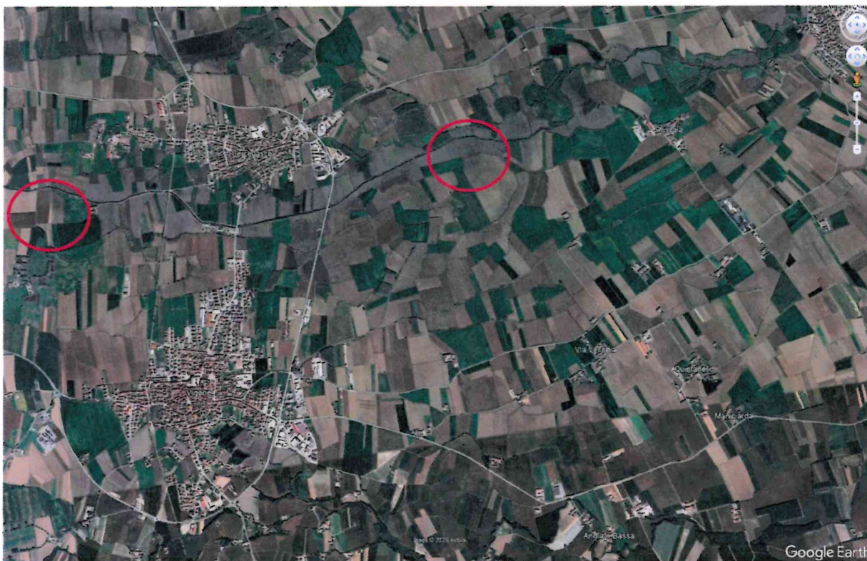
ESTRATTO CARTOGRAFICO (Base catastale) Comune di Vigone