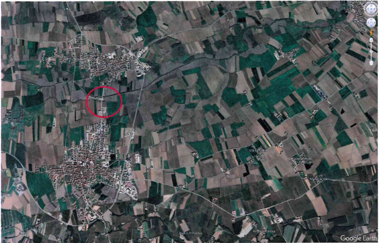
ESTRATTO CARTOGRAFICO (Base catastale) Comune di Vigone